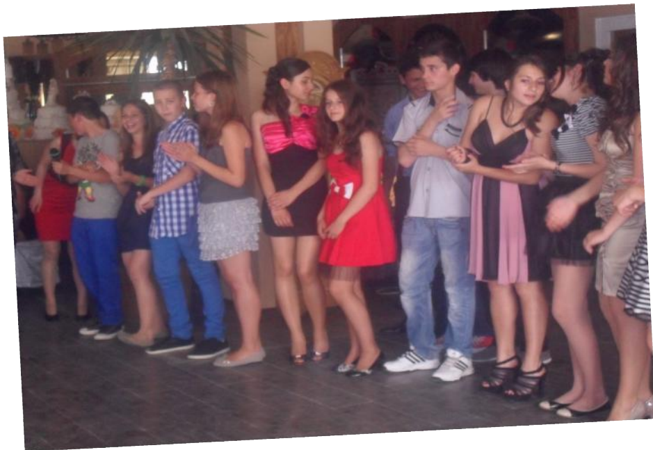
23 DE CANDIDAȚI....