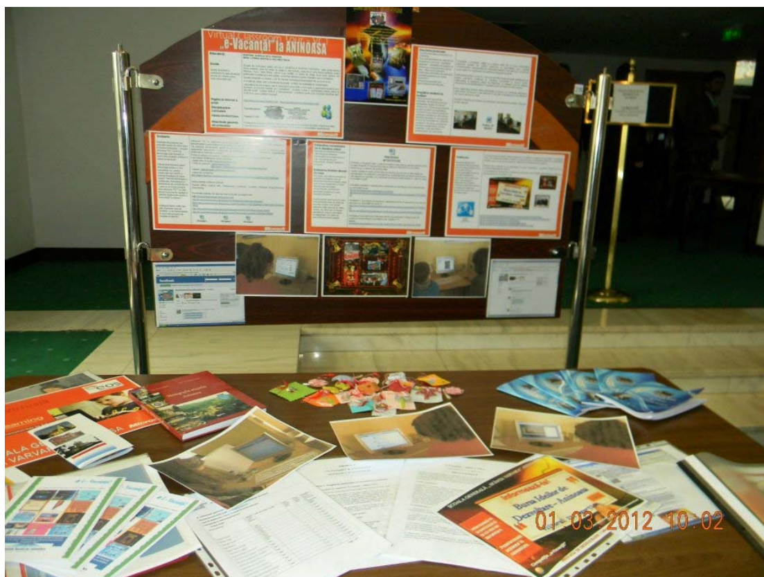
Proiectul „E-Vacanță la Aninoasa” a fost prezentat la Forumul Inovatorilor în Educație desfășurat la Brașov 1-2 martie 2012