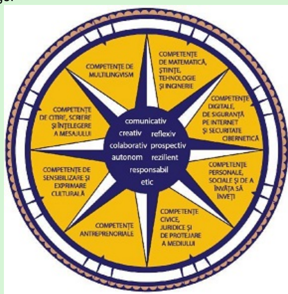
Figura 1*). Dimensiuni principale care contribuie la definirea profilului de formare al absolventului

Profilul de formare al absolventului funcționează ca o busolă pentru întregul sistem educațional, în care elementele continuumului predare-învățare-evaluare conlucrează pentru realizarea idealului educațional definit în lege.