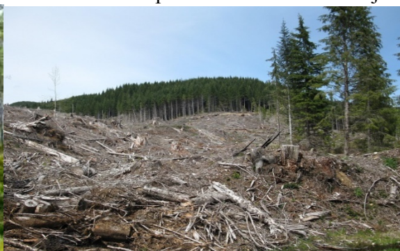
Foto 4. Defrișări