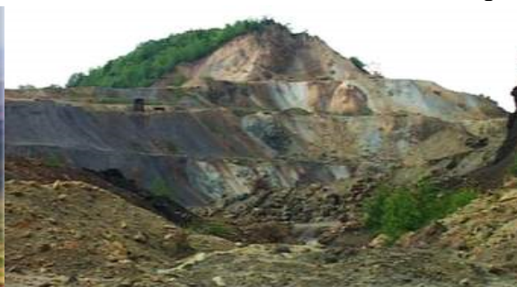
Foto 2. Exploatări miniere la Certej