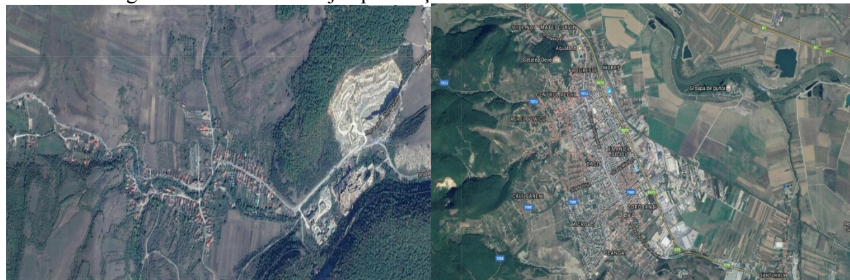
Foto 5. Așezare rurală

Utilizând imaginea satelitară de mai jos precizați: