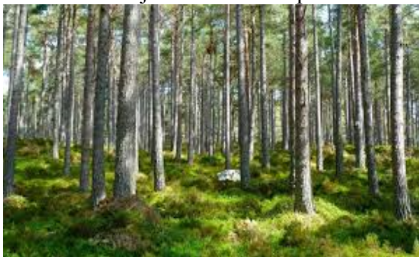
Foto 3. Ecosistem forestier/ pădure