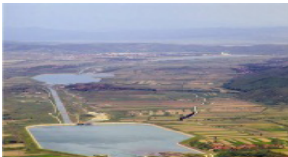
Foto 1. Amenajări hidrotehnice pe Râul Mare