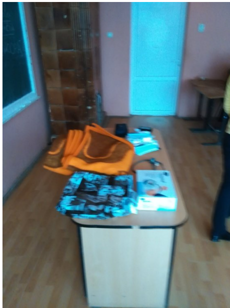
Instrumente medicale folosite