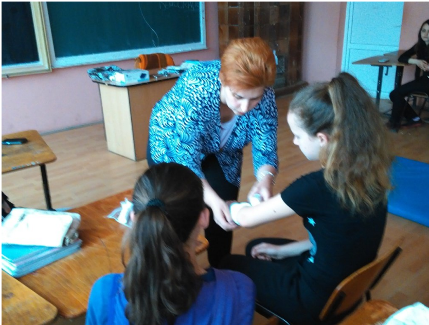
Cum ne facem un pansament dacă suntem arși

www.facebook.com/Scoala-Gimnaziala-Densus