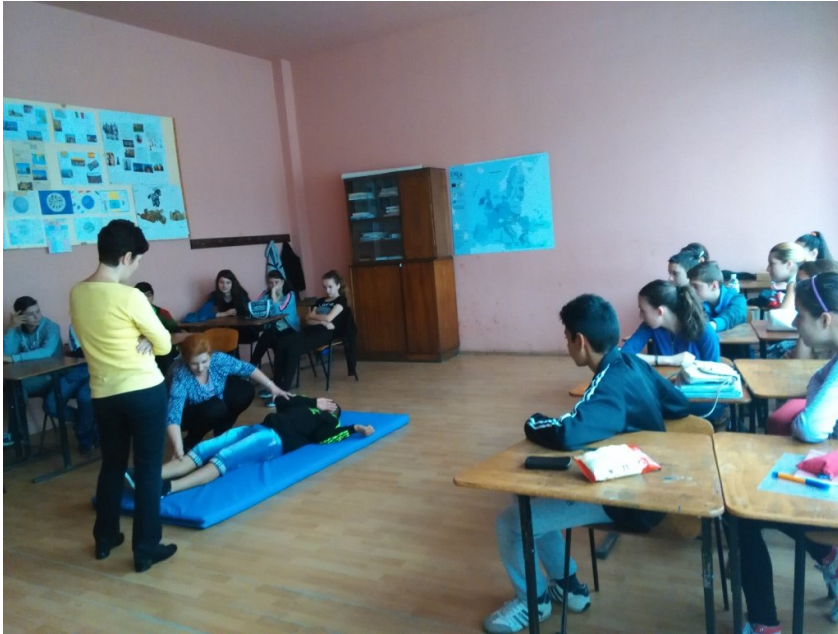
Cum acordăm primul ajutor în cazul unui infarct