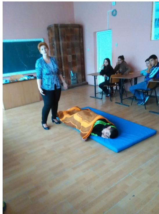
Vedem cum se acordă primul ajutor în caz de accident