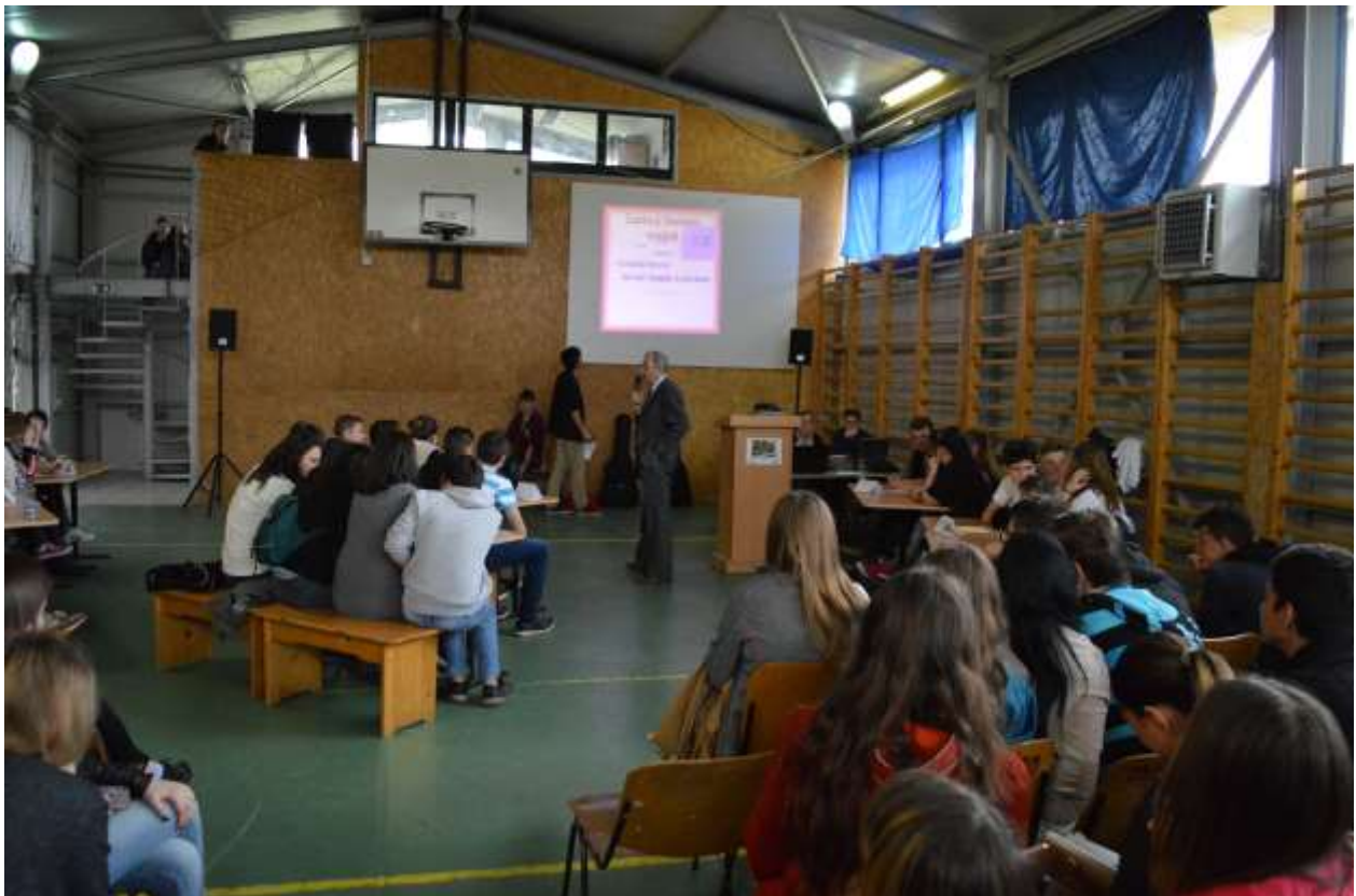
ASPECTE DIN TIMPUL ACTIVITAȚII