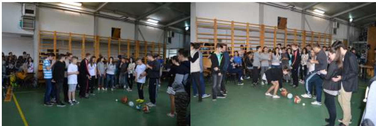
PROBELE SPORTIVE ...